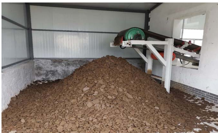
图 9-1 污泥脱水后照片

该项目生活垃圾、栅渣经封闭垃圾桶收集，由环卫部门定期清运；污泥经隔膜压滤机脱水预处理，脱水污泥委托济南德兴环境工程有限公司运输至阳谷县金成新型建材有限公司处置，该项目已签订污泥运输处置合同。固体废物均能够得到妥善处理及综合利用，实现固体废物“减量化、资源化、无害化”要求。