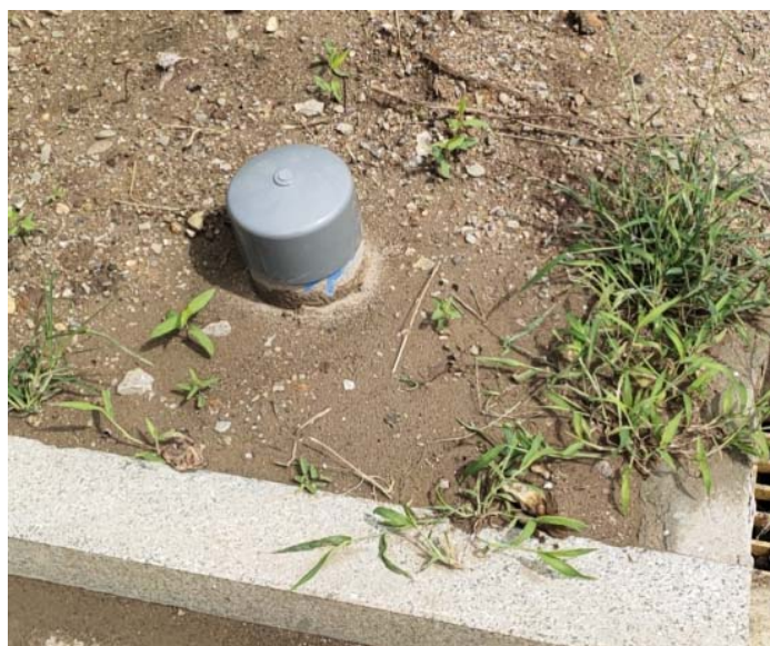
图 4-3 地下水监控井照片（生化池附近）